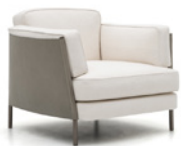
3 SHELLEY POLTRONA CM 85X87 H70