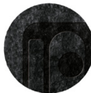
9 WISP RELIEF TAPPETO Ø CM 500