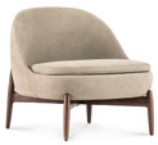
05 SENDAI POLTRONE CM 74X76 H72