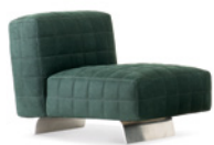
06 TWIGGY POLTRONE LARGE CM 84X90 H66