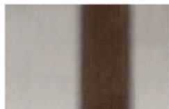
10 LANDFIELD STRIPES TAPPETO CM 600X400