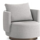
03 TORII BOLD POLTRONE LARGE GIREVOLI CM 94X94 H82