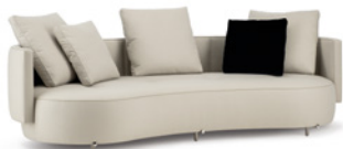
02 TORII BOLD DIVANO CURVO CM 247X106 H82