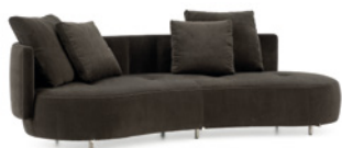
01 TORII BOLD DIVANO CURVO PENISOLA SX CM 240X106 H82