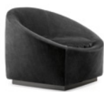
04 CAPRI BASE POLTRONA CM 98X90 H70