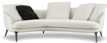
03 RAPHAEL DIVANO INCLINATO CM 247X135 H88