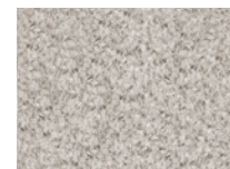
11 WISP TAPPETO CM 400X300