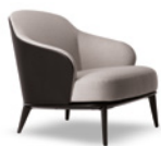
04 LESLIE FAUTEUILS CM 78X87 H75