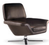
05 BLAKE-SOFT POLTRONA CM 94X98 H89