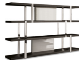
12 DALTON "CHROME" LIBRERIA CM 240X40 H148