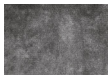
13 DIBBETS TAPPETO CM 500X500