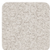
15 WISP ROUNDY TAPIS CM 600X600