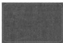
08 OUTLINE TAPPETO CM 450X350