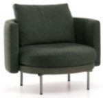
03 TORII "MEDIUM" SESSEL DREHBAR Ø CM 88 H72