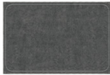
08 OUTLINE TEPPICH CM 450X350