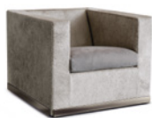
04 SUITCASE LINE FAUTEUILS CM 75X85 H64