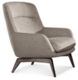
03 BELT BERGÈRE CM 78X84 H93