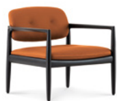
03 YOKO POLTRONE CM 77X75 H73