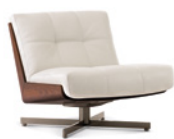
04 DAIKI POLTRONA SENZA BRACCIOLI CON BASE GIREVOLE CM 73X91 H69