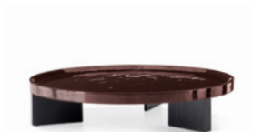
08 LOUVER TAVOLINO Ø CM 120 H25