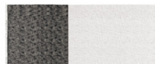
10 CROSS FLAG TAPPETO CM 600X300