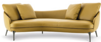
01 RAPHAEL DIVANO INCLINATO CM 247X135 H88