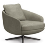
02 RAPHAEL POLTRONE GIREVOLI CM 74X86 H78