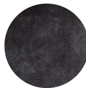
07 DIBBETS TAPPETO Ø CM 400 - SPECIAL SIZE