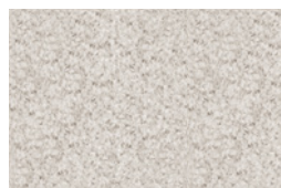
13 WISP TAPPETO CM 600X500