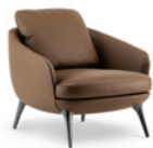
05 RAPHAEL POLTRONA LARGE CM 82X90 H78