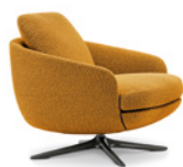
03 RAPHAEL POLTRONE GIREVOLI CM 74X86 H78