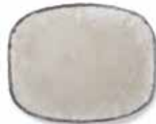
11 DIBBETS FRAME "TONNEAU" TEPPICH CM 400X300