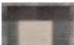
12 LANDFIELD "STARDUST" TEPPICH CM 500X300