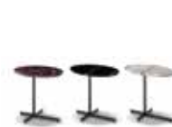
7 JOY "JUT OUT" PETITE TABLE CM 50X35 H45