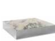
6 ELLIOTT PETITE TABLE CM 120X120 H25