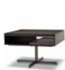
5 CLOSE PETITE TABLE CM 80X80 H53