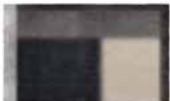
8 LANDFIELD "ECLIPSE" TAPIS CM 300X300