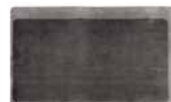
11 DIBBETS CAMBRÉ TAPIS CM 600X300