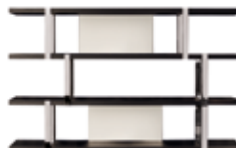
10 DALTON "CHROME" BIBLIOTHEQUÈ CM 240X40 H148