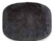
11 DIBBETS "TONNEAU" TEPPICH CM 400X300