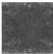
13 MATT DIBBETS TEPPICH CM 500X300