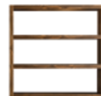
12 JOHNS BÜCHERREGAL CM 180X40 H174