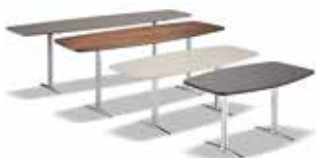
7 WILSON CONSOLLE CM 180X50 H55