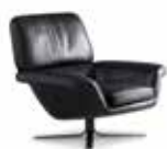
3-4 BLAKE-SOFT POLTRONA CM 94X98 H89 POUF CM 65X65 H38