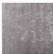
11 DIBBETS TAPPETO CM 300X300