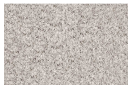
10 WISP TAPIS CM 600X500