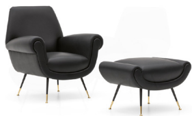
5-6 ALBERT FAUTEUIL CM 84X77,5 H92 REPOSE-PIED CM 70,5X52,5 H46