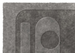
12 WISP RELIEF TAPPETO CM 600X500