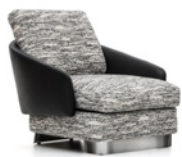
6 LAWSON LARGE POLTRONA CM 84X98 H80