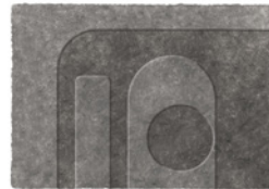
12 WISP RELIEF TEPPICH CM 600X500