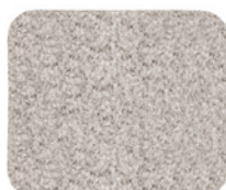
11 WISP ROUNDY TEPPICH CM 400X300