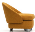
6 LAWSON LOUNGE POLTRONA CM 72X78 H74