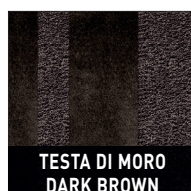
TESTA DI MORO DARK BROWN