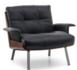
02 DAIKI SESSEL CM 93X91 H69