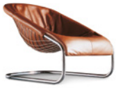
02 CORTINA SESSEL CM 73X97 H71