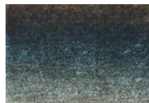
10 DIBBETS "RAINBOW" TAPPETO CM 500X400