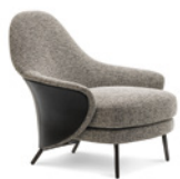
04 ANGIE POLTRONE CM 88X94 H87