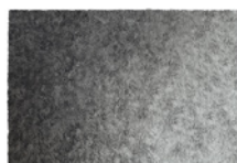
08 WISP RAINBOW TAPPETO CM 600X500