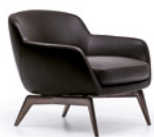
03 BELT POLTRONE CM 78X81 H71