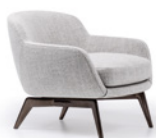
04 BELT POLTRONA CM 78X81 H71