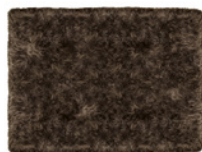
13 ALPS TAPPETI CM 450X350