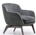
05 BELT POLTRONE LOUNGE CM 73X72 H71