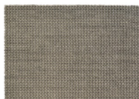
08 JERSEY TAPPETO CM 350X250