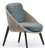
03 LIDO CORD OUTDOOR POLTRONCINE LOUNGE CM 72X81 H83