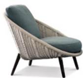
02 LIDO CORD OUTDOOR POLTRONA CM 88X95 H82