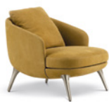
02 RAPHAEL POLTRONE CM 74X86 H78