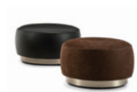
03 TORII BOLD POUF MEDIUM Ø CM 71 H41