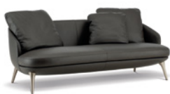
02 RAPHAEL DIVANO CM 192X91 H88