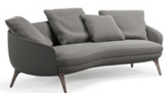
01 RAPHAEL DIVANO CURVO CM 227X118 H88