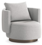
02 TORII BOLD POLTRONE LARGE GIREVOLI CM 94X94 H82