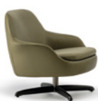
04 SENDAI POLTRONE CON BRACCIOLI CM 87X83 H78