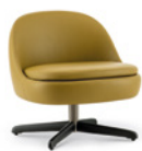
03 SENDAI POLTRONE LOUNGE GIREVOLI CM 65X67 H67