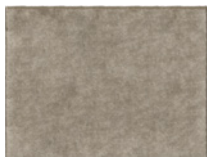
09 FAIRWAY TAPPETO CM 350X250