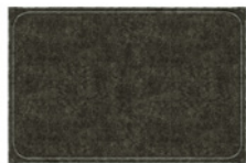
08 OUTLINE TAPPETO CM 600X400