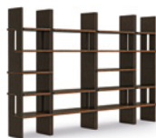
08 ZOE LIBRERIA CM 100X46 H103