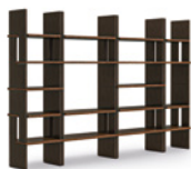
07 ZOE LIBRERIE CM 60X46 H103