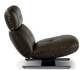
05 LIBRA BERGÈRE CM 78X102 H82