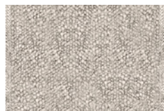
09 ZEALAND TAPPETI CM 400X300