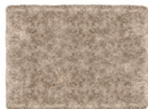
11 ALPS TAPPETI CM 450X350